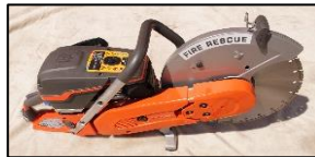
② エンジンカッター

交通事故で車が変形して出られなくなった人や、機械に挟まれて身動きがとれなくなった人を助け出すときに使用します。