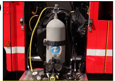
④ 水難救助用資器材