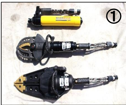
① 油圧救助器具 (上からラムシリンダー、カッター、スプレッダー)

交通事故で車が変形して出られなくなった人や、機械に挟まれて身動きがとれなくなった人を助け出すときに使用します。